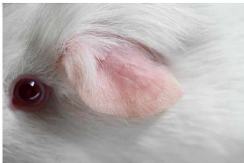
Figuur 2 - Ogen en oren bij een witte roodoog in gladhaar

Wanneer we als fokker de standaard bij de hand nemen, dan zien we dat deze vraagt om een correct gebouwde cavia met het correcte type. Waar vooral de nadruk opgelegd wordt in de standaard, is het ontbreken van pigment op alle vlakken. Zo wordt de kleur wit omschreven als zuiver wit! Zowel in de dekkleur alsook in de onderkleur mag niets van pigmentering te vinden zijn. De huid van deze prachtige parels is dan ook mooi roze. Op de oren en poten moet alle pigmentering eveneens ontbreken. We verwachten hier dan ook een mooi gevormd, vleeskleurig oor zonder