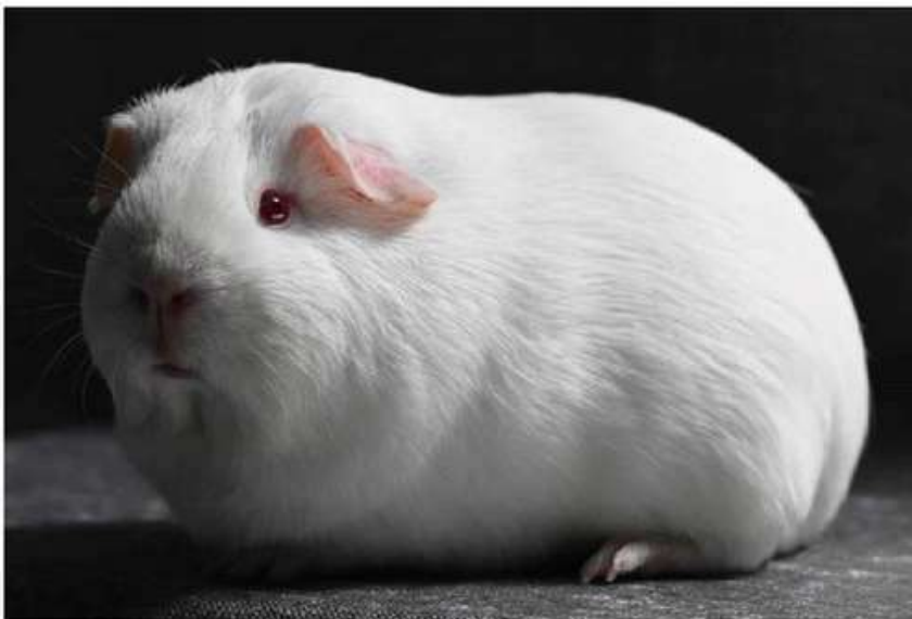
Figuur 4 - Een voorbeeld van een mooie Witte Rodoog in gladhaar.

Daarnaast komt ook het onderhoud van de dieren sterk aan bod bij deze cavia's. Witte dieren die in vuile hokken worden gehouden, zullen al snel een gele waas aan de buik gaan tonen. Dit wordt niet gewaardeerd op de keurplank. Daarenboven komt nog de uitdaging om de volledige vacht schoon te houden. Deze uitdaging is nog zoveel groter bij de langharen in deze kleurslag. Elke vorm van kleurverschil in het wit zal leiden tot puntenaftrek op de keurkaart. En toch is het mogelijk om topdieren op de plank te brengen. Dit werd laatst nog bewezen op de caviadag te Aalten (NL). Daar