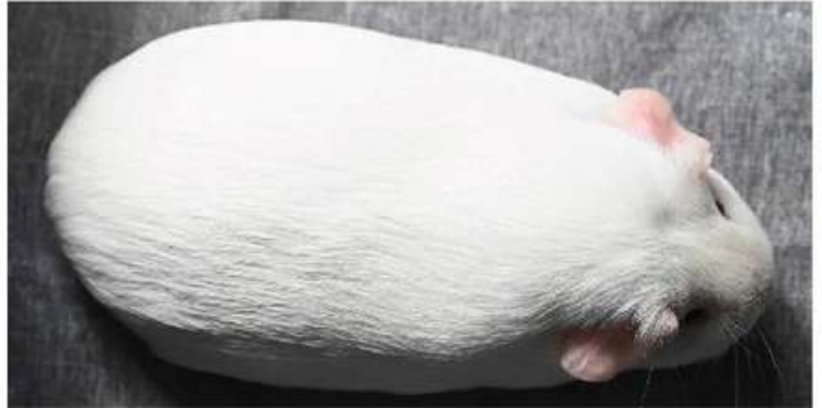
Figuur 3 - Dit dier toont een mooie witte vacht zonder enige aanslag of pigmentering.

Als fokker van een witte roodoog kom je wel voor een aantal uitdagingen te staan wanneer je een topdier op de plank wil brengen. Deze dieren kunnen geen punten scoren op tekening of patroon. Ze zijn puur en zonder omwegen. Alles wat er op zit, of net niet op zit, is heel snel zichtbaar voor een keurmeester. Als fokker word je gedwongen om terug te gaan naar de basis van het fokken. Bouw en type worden vooropgesteld met een enorme aandacht voor pigmentering. Selectie en fokkerskunst zullen bij deze kleurslag hand in hand gaan.